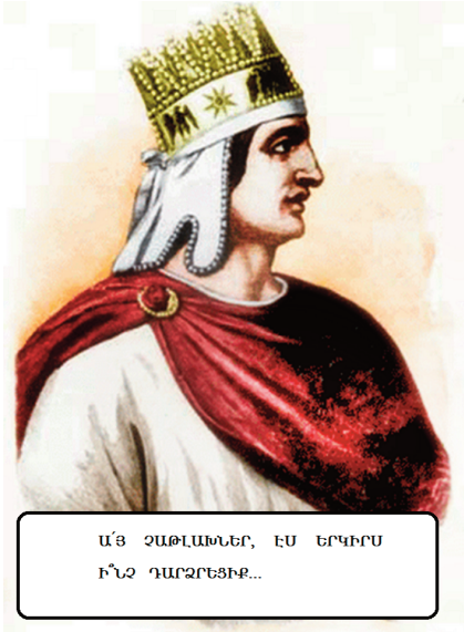
ԱՅ ԶԱԹԼԱՍՆԵՐ, ԷՍ ԵՐԿԵՐՍ ԻՆՉ ԴԱՐՉԵՏԻՔ...

« Ապրի՛ր զմեռնելու, մեռի՛ր ապրելու համար »: Գարեգին Նժդեհ